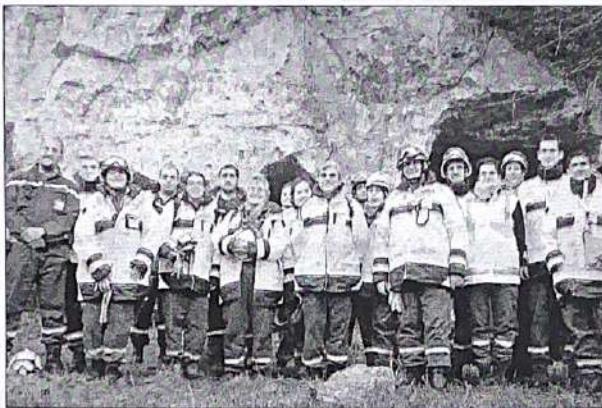
Ce week-end, des sauveteurs se sont entraînés dans les bunkers, mais aussi dans les carrières de Laffaux.

La section soissonnaise d'Alcool assistance (16, rue du Docteur-Roy), aide et accompagne les personnes en difficulté avec l'alcool, et leur entourage. L'équipe accueille les intéressés en toute discrétion et leur apporte écoute, disponibilité et accompagnement dans l'abstinence. Permanences les mercredis, de 18 à 20 heures. Désormais, pour permettre à