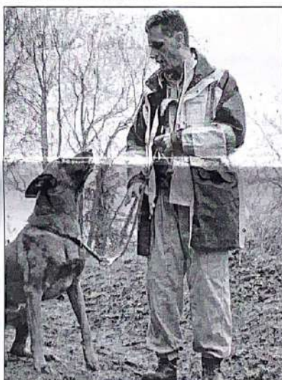
Dusty repère et signale la présence humaine sous les décombres à son maître.

Depuis 2009, l'ancien camp devient peu à peu un lieu de formation. Ce ne serait pas possible sans le travail des bénévoles de l'ASW2. Défrichage, élagage, entretien et restauration : une action de sauvetage, là aussi, d'un lieu historique où 22 000 ouvriers français et étrangers du service du travail